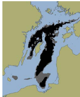
Utbredningen av döda bottnar i Östersjön år 2022.

På djupt vatten förbrukas istället syre när döda växter och djur singlar ner mot botten och bryts ner. Haloklinen fungerar som ett lock, som förhindrar omblandning av vattnet. Till slut kan syrebristen på djupt vatten bli så stor att bara vissa mikroorganismer, som klarar sig utan syre, kan leva där, och så kallade ”döda bottnar” uppstår.